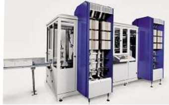
Verpackautomat Dürselen VA.02.

Die Broschürenstapel werden dem Verpackautomaten zugeführt und je nach Laufrichtung um 90 Grad gedreht. Es folgt eine