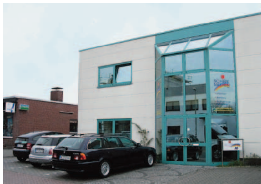
Ein ansprechendes Betriebsgebäude im Industriegebiet von Hamminkeln beherbergt die Schirk Medien GmbH.